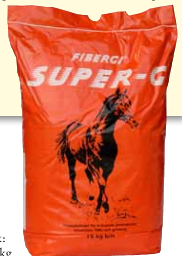
Förpackningsstorlek: Säck 15 kg Pall 300 kg