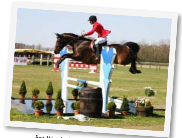
Bee Wonderful är uppfödd på FIBERGI.