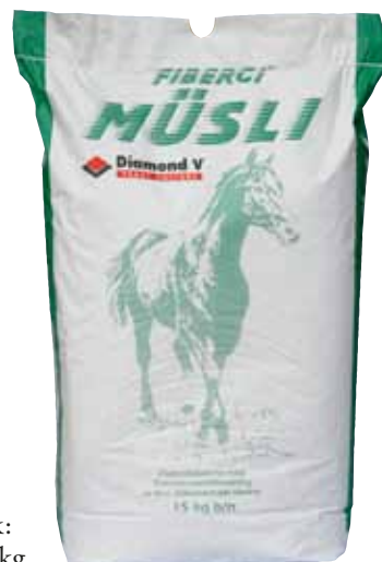
Förpackningsstorlek: Säck 15 kg Pall 420 kg

Ovanstående skall ses som ett exempel, individuella variationer finns alltid.